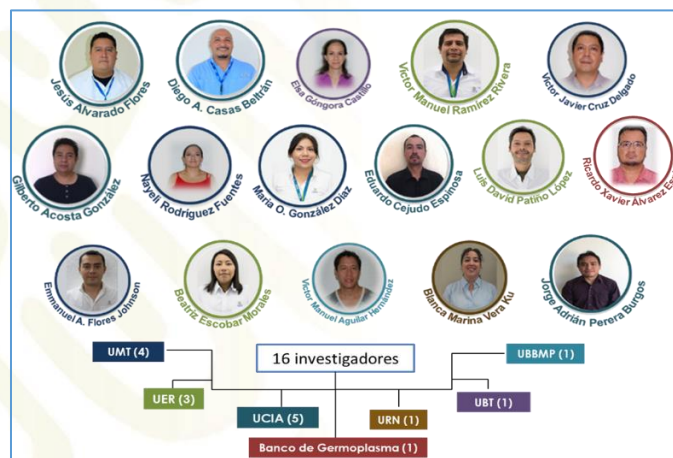
Figura 3. Investigadores(as) en el CICY del programa de Cátedras de jóvenes investigadores del Consejo Nacional de Ciencia y Tecnología (CONACYT)

El Centro cuenta actualmente con 16 Investigadores(as) del programa de Cátedras de jóvenes investigadores del Consejo Nacional de Ciencia y Tecnología (CONACYT), mismos que de manera paralela desarrollan los proyectos primordiales que dieron origen a su integración en el Centro, en conjunto con proyectos que han conseguido para fortalecer su desempeño científico y tecnológico. Así, se tienen seis proyectos vigentes en los que su responsable técnico es un investigador(a) del programa cátedras