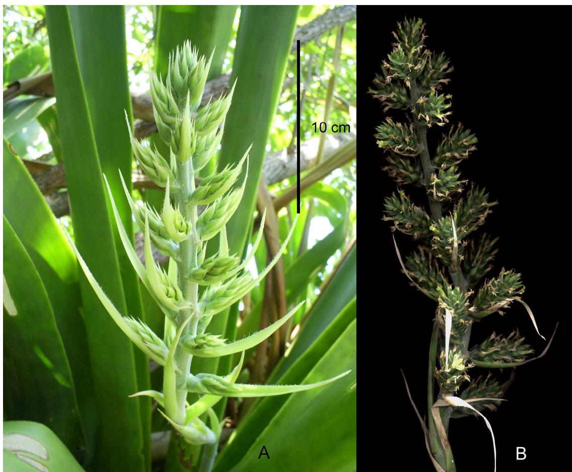
FIGURA 1. Hohenbergia mesoamericana I. Ramírez, Carnevali & Cetzal (basado en W. Cetzal Ix 20, holotipo CICY, isotipo MO). A. Planta en hábitat. B. Detalle de la inflorescencia.

Hohenbergia , un género de bromelias con ca. 61 especies, era conocido antes de este descubrimiento, de las Antillas, Colombia, Venezuela y Brasil. La pregunta