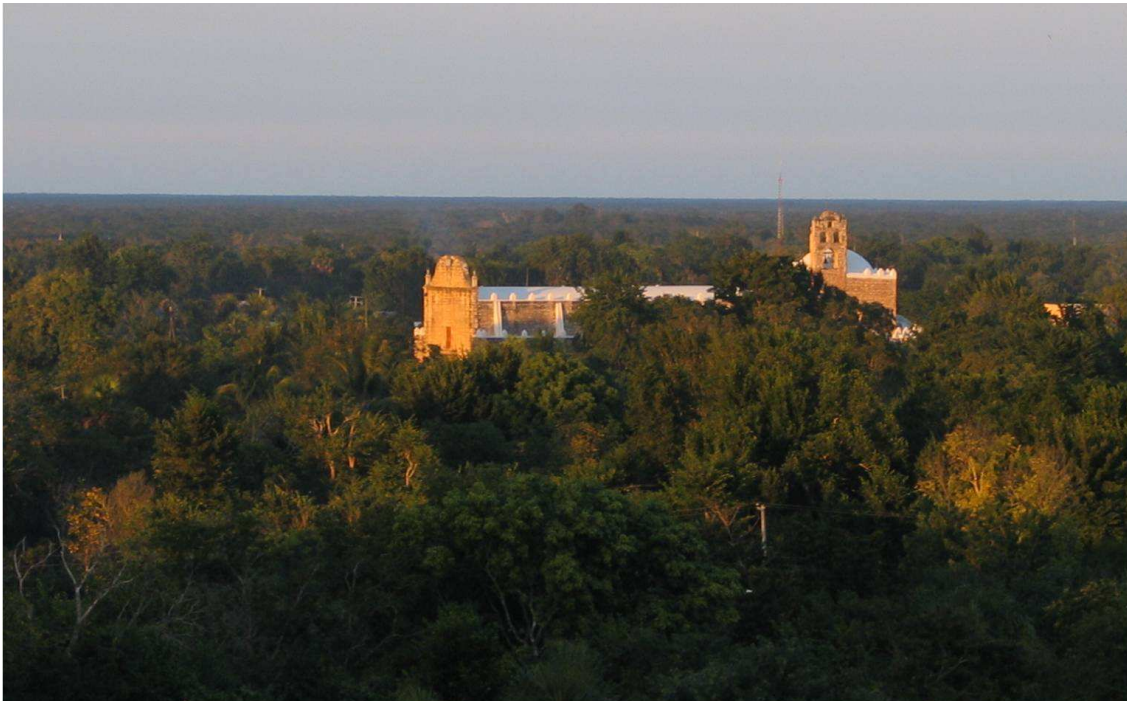
FIGURA 1. Planicie del norte de la Península de Yucatán, vista desde “el cerro” de Maxcanú (en la Sierrita de Ticul), donde los poblados aparecen como oasis de vegetación exuberante ante la vegetación rala de las selvas secas que los circundan. Imágenes como esta cautivaron a Heilprin. En esta planicie, los edificios como las iglesias y los templos mayas son los pocos sitios desde donde puede apreciarse el paisaje.

por cierto famoso en el círculo científico de su época. En 1887 publicó un libro importante para la historia de la biogeografía: “The Geographical and Geological Distribution of Animals” (Distribución Geográfica y Geológica de los Animales). Heilprin sacudió la opinión de sus colegas, entre ellos el grandioso Alfred Wallace, al plantear que en el hemisferio norte del planeta, era mejor reconocer solo un reino biogeográfico, el Holártico, y no dos, como era aceptado, el Paleártico y el Neártico. Considerando el aporte de este autor, hablar de él en Yucatán no es poca cosa, al menos para los interesados en la historia científica de la región.