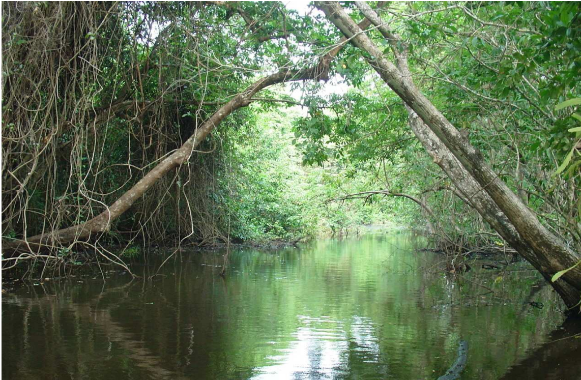
FIGURA 3. Ecosistema conservado, en Río El Este (Las Cruces). (López-Contreras J.E.).

Palabras clave: Aves, humedales, Laguna de Términos, Campeche.