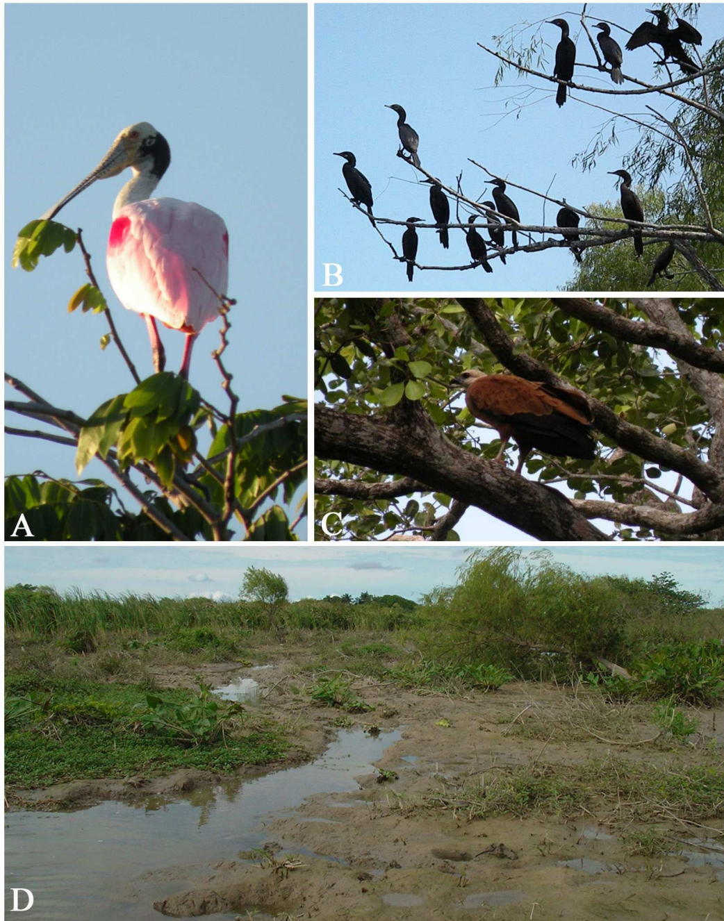
FIGURA 2. A-E. A. Espátula rosada o chocolatera Platalea ajaja sobre un biché Inga vera Willd. Familia: Leguminosae Tipo de hábitat: Selva baja inundable. (López-Contreras J.E.). B. Cormoranes Phalacrocorax auritus sobre un sauce Salix humboldtiana Willd. Familia: Salicaceae. Tipo de hábitat: Vegetación riparia. (López-Contreras J.E.). C. Aguililla canela Busea nigricollis sobre un pukté Bucida buceras L. Familia: Combretaceae. Tipo de hábitat: Selva baja inundable. (López-Contreras J.E.). D. Perturbación del ecosistema, en Río Palizada. (Amador-del Ángel L.E.).