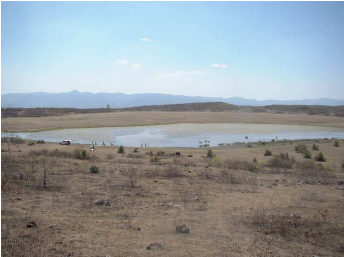
Figura 1. Vista de la Laguna El Pedregal. (Fotografía: Hermes Vega).

Con estas dos especies, aumenta el número de plantas reportadas para nuestra flora. Honduras es un país por descubrir, posee una biodiversidad vegetal excepcional, muchas de las especies aún están a la espera de ser descubiertas por los ojos curiosos de las personas que dedicamos nuestro tiempo a la documentación y estudio de la vegetación.