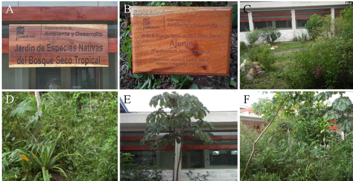
Figura 1. Vistas y rótulos del Jardín de Especies Nativas del Bosque Seco Tropical.

nivel mundial. Los nuevos bosques requerirán una gestión adaptativa como sistemas dinámicos y resistentes, que pueden soportar las tensiones del cambio climático, la fragmentación del hábitat, y otros efectos antropogénicos (Young et al. , 2005; Chazdon, 2008).