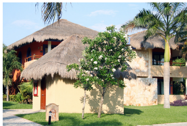
El sector servicios es clave en la economía estatal.

Entonces, por un lado, el gran peso específico de este sector dentro de la economía estatal registró poca variación en el período analizado y, por el otro, su crecimiento presenta una tendencia a la baja, más notable en los últimos años revisados.