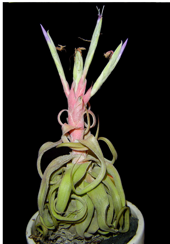
FIGURA. Tillandsia aff. streptophylla , proveniente de Los Chimalapas, Oaxaca.

En 2008, parte del equipo del herbario del CICY realizó una salida de campo al estado de Oaxaca, encontrando lo que tal vez sería un símil al caso de H. floresiensis , aunque en este caso, con una planta. En el piedemonte occidental de la sierra de Los Chimalapas, se encontró una población de individuos similares a Tillandsia streptophylla cuyos adultos son marcadamente más pequeños que la forma