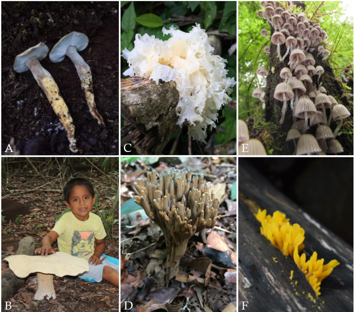
Figura 2. Representación de algunos hongos comestibles del mundo: A. Pseudofistulina radicata (Schwein.) Burds. B. Macrocybe titans (H.E. Bigelow & Kimbr.) Pegler, Lodge & Nakasone. C. Tremella fuciformis Berk. D. Phaeoclavulina cyanocephala (Berk. & M.A. Curtis) Giachini. E. Coprinellus disseminatus (Pers.) J.E. Lange. F. Dacryopinax spathularia (Schwein.) G.W. Martin.

nivel mundial (Boa 2004). Si cruzamos la lista de esa publicación y de otros trabajos más recientes con las especies conocidas para la península de Yucatán, observamos que además de las 19 especies mencionadas en la sección anterior, se agregan 18 más (Cuadro 2, Figura 2).