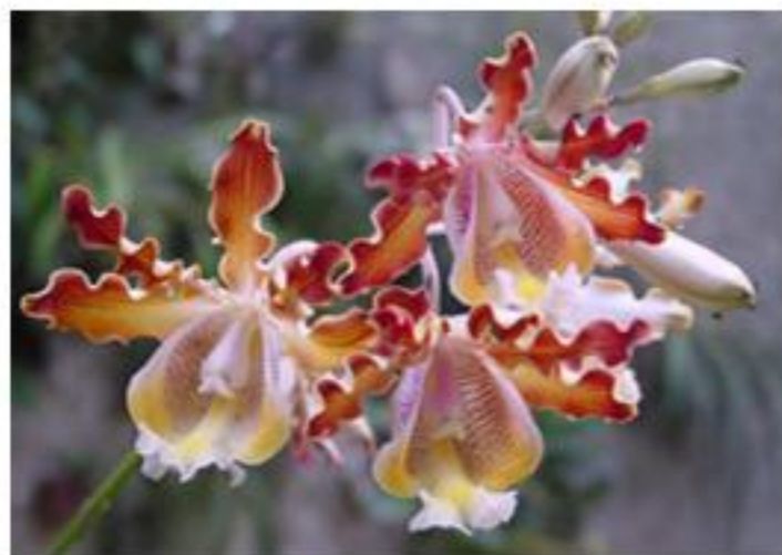
Myrmecophila christinae Carnevali & Gómez-Juárez, una hermosa orquídea de la duna costera.

El herbario CICY esta abierto a todo el público interesado en el conocimiento de las plantas. Su horario es de 8:00 am a 5:00 pm de lunes a viernes.